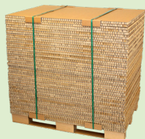
+ 50 pappskivor