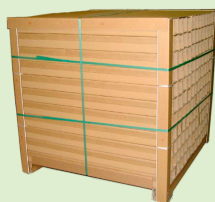
150 Självhäftande PallRuns®

Utrymmet i lagret kan reduceras med upp till 80%!